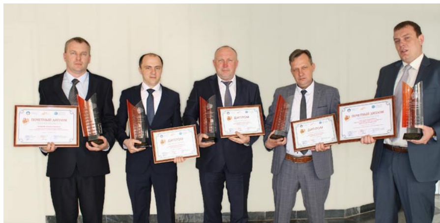
Победители профессионального конкурса «На лучшее достижение в строительной отрасли Республики Беларусь за 2017 год»